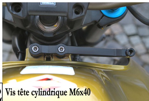
2 Vis tête cylindrique M6x40