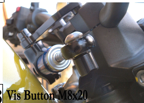
8 Vis Button M8x20