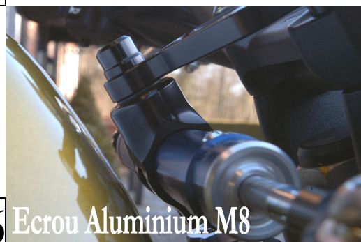
6 Ecrou Aluminium M8