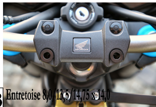
3 Entretoise 8,0/13,5/14,75 x 14,0