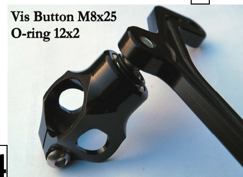
Vis Button M8x25 O-ring 12x2