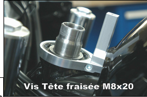
Vis Tête fraisée M8x20