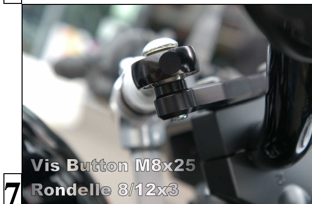
Vis Button M8x25 Rondelle 8/12x3